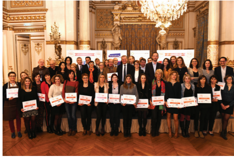
Cérémonie de remise des prix 2017

Le concours Initiative «♀» féminin récompense les cheffes d'entreprise lauréates de France Active et Initiative France en Auvergne-Rhône-Alpes.